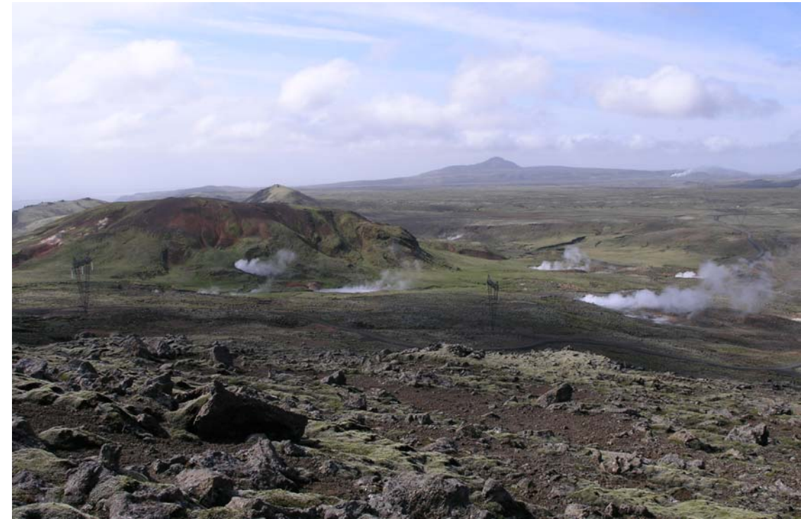
Mynd 6. Ölkelduhnúkur séð frá Ölkelduhálsi.