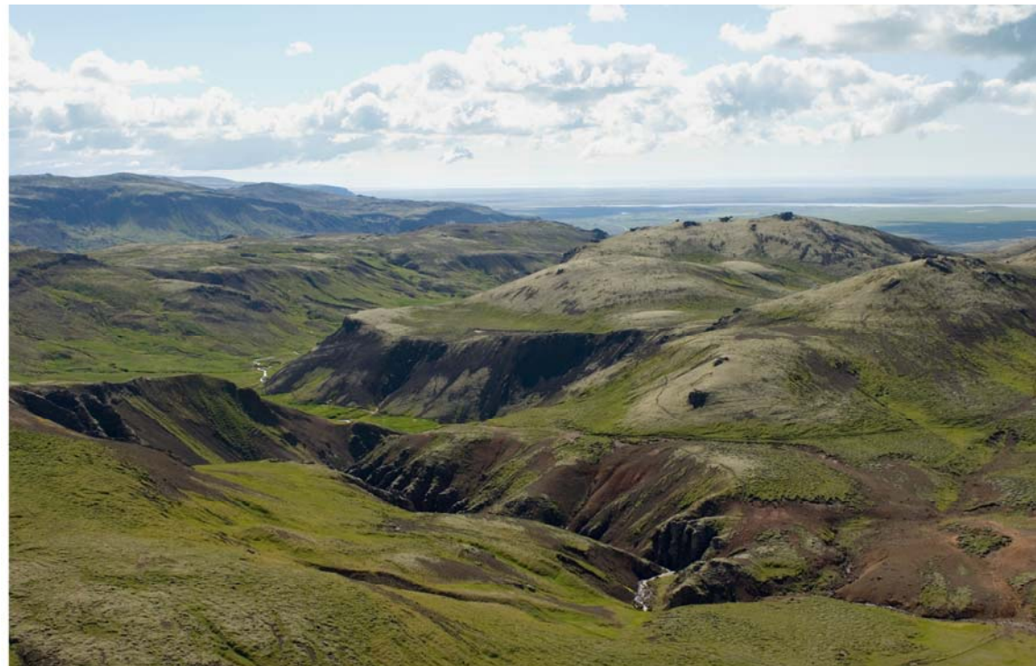
Mynd 7. Klambragil og Reykjadalur.