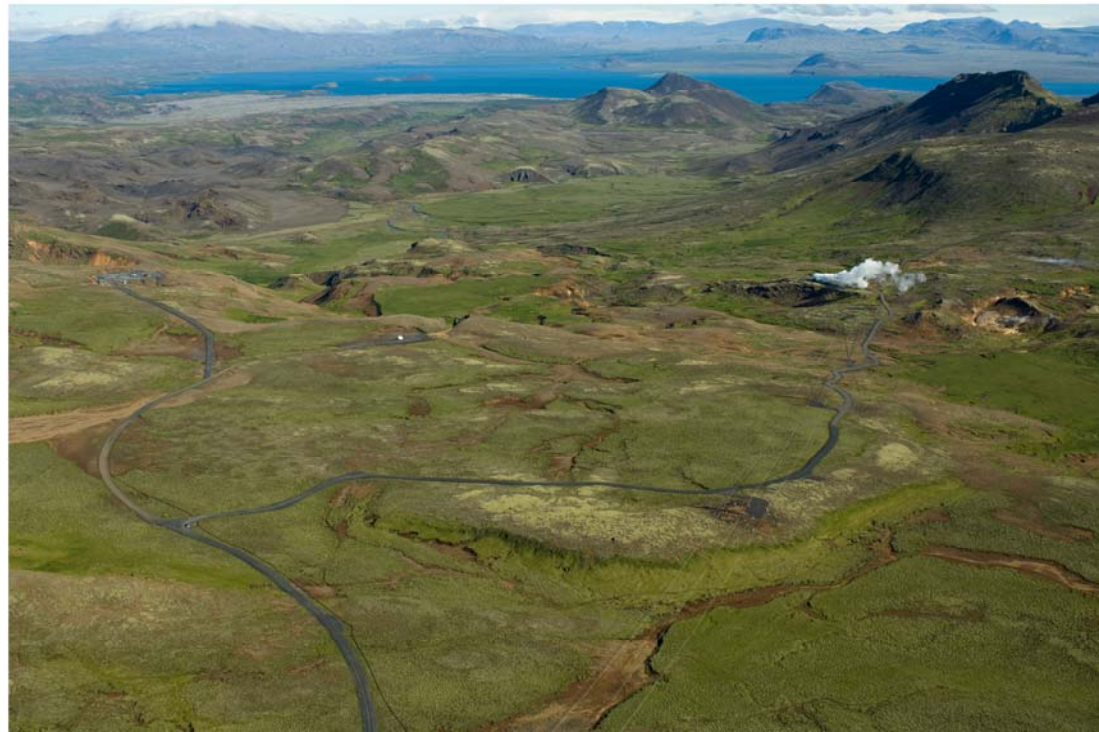
Mynd 1. Núverandi vegslóðar, línur og borteigar á Bitru. Horft til norðurs að Þingvallavatni.