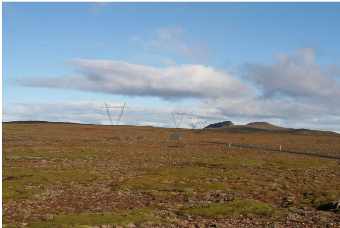
Mynd 3. Bitra, horft til norðurs. Tjarnarhnúkur hægra megin.