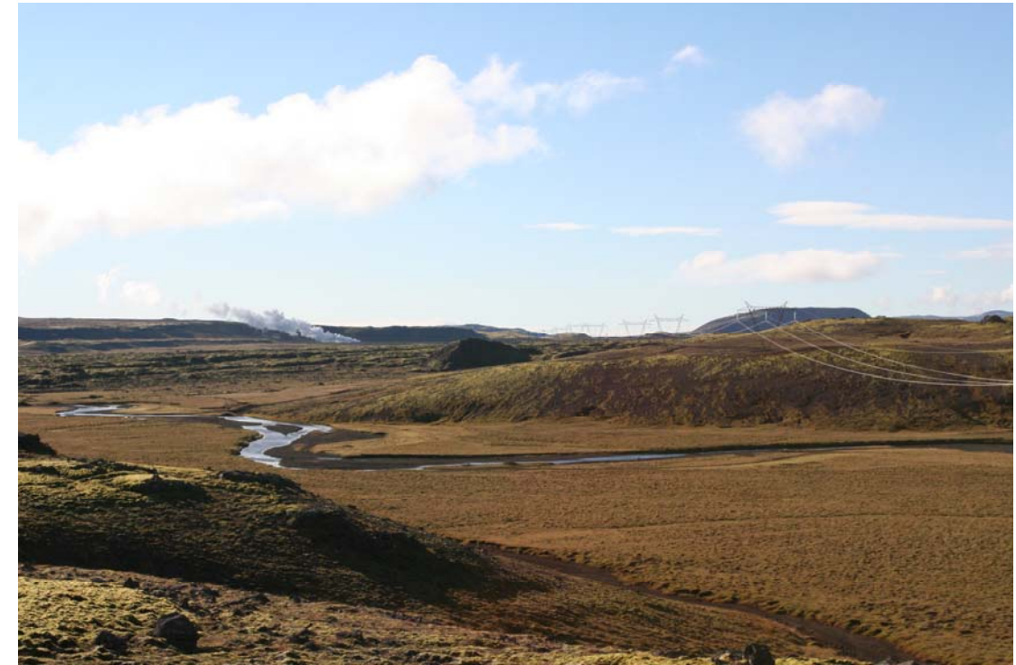
Mynd 2. Hengladalaá með Orustuhólshraun í baksýn. Horft til suðurs.