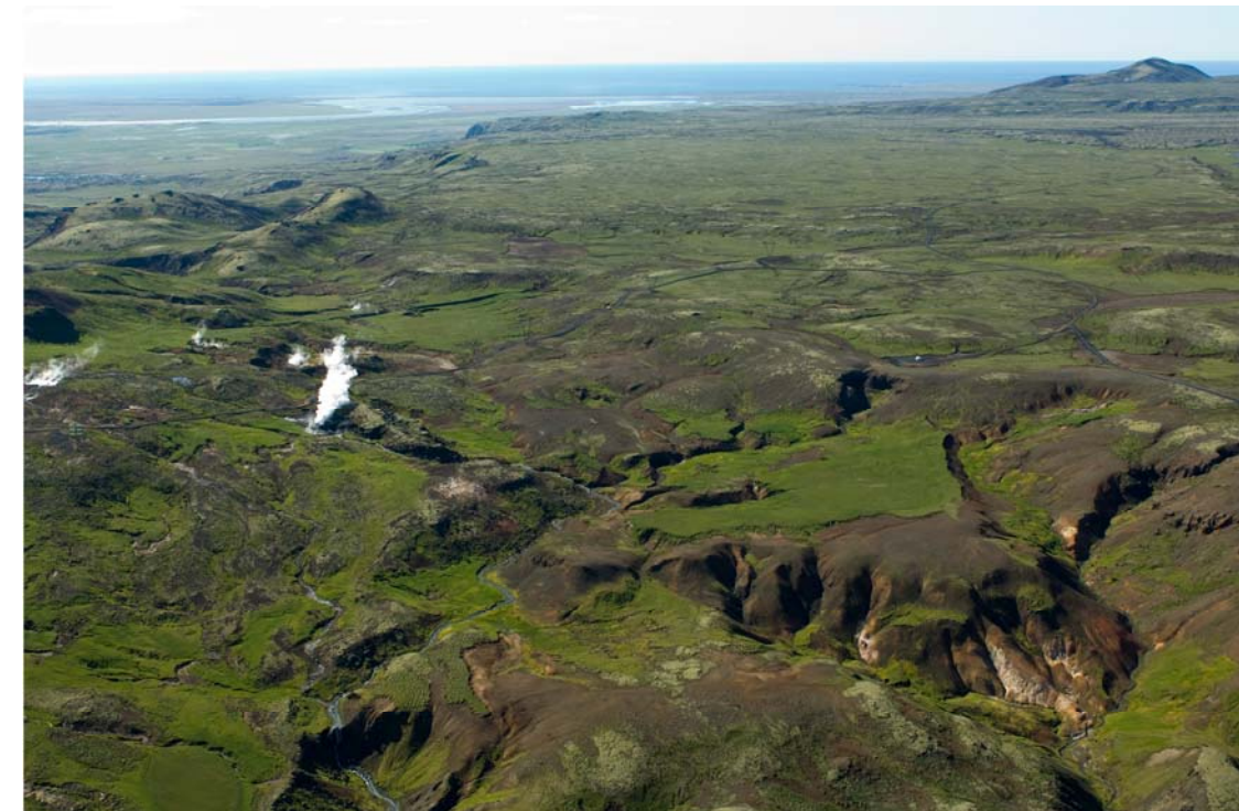
Mynd 4. Bitra, horft til suðurs. Molddalahnúkar lengst til vinstri.